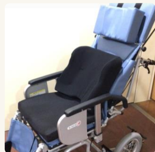
▲二つを組み合わせ使用することも可能です。