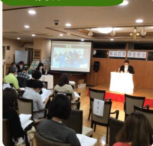
▲会場を二つに分けて実施いたしました。